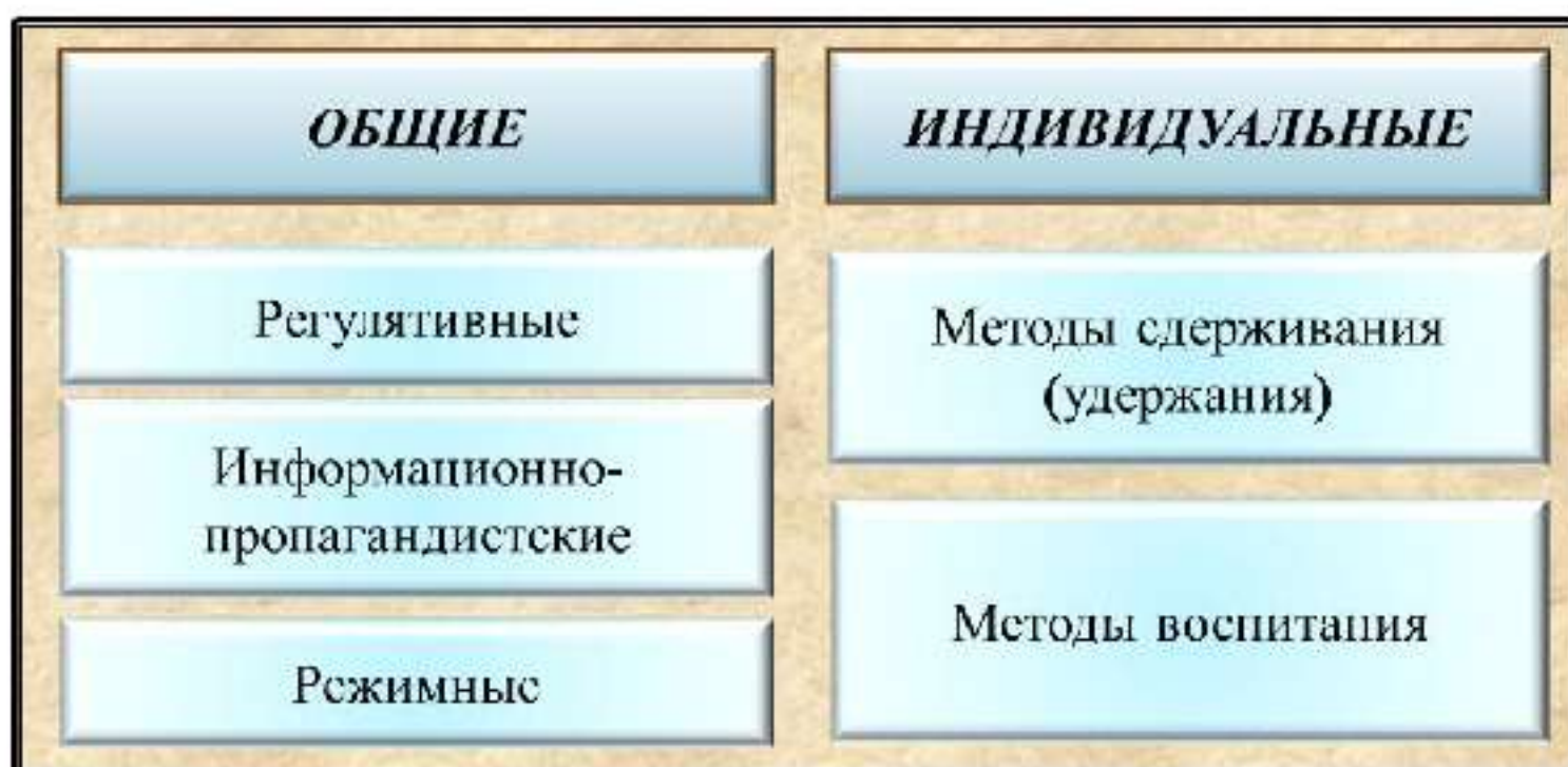
Рис. 12. Методы профилактики терроризма

Методы общей профилактики рассчитаны на оказание предупредительного воздействия на неопределенное множество лиц, на население и его отдельные группы. К данной группе методов относятся: