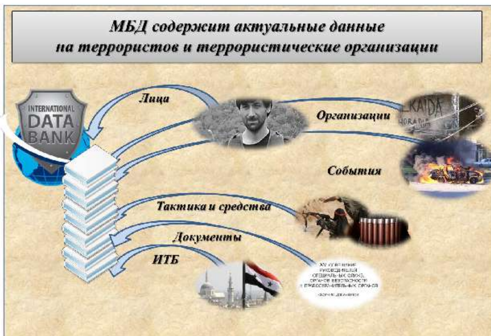
Рис. 10. Структура Международного банка данных по противодействию терроризму

удобном для пользователя виде, в том числе с визуализацией на географической электронной карте, а также в виде графиков и диаграмм. Предусмотрена удобная навигация по разделам банка и возможность создания запросов, позволяющих выявлять связи между различными объектами.