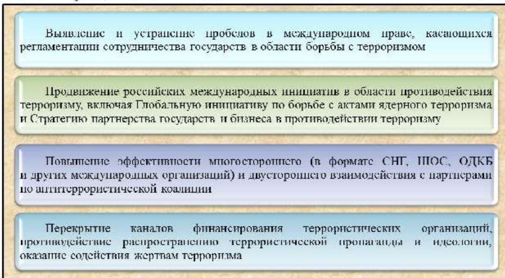
Рис. 11. Основные направления международного сотрудничества в сфере противодействия терроризму

Различают международный, межгосударственный, региональный и межведомственный уровни антитеррористического сотрудничества. Каждому из них соответствует определенный перечень нормативных правовых актов, своя специфика, задачи и методы.