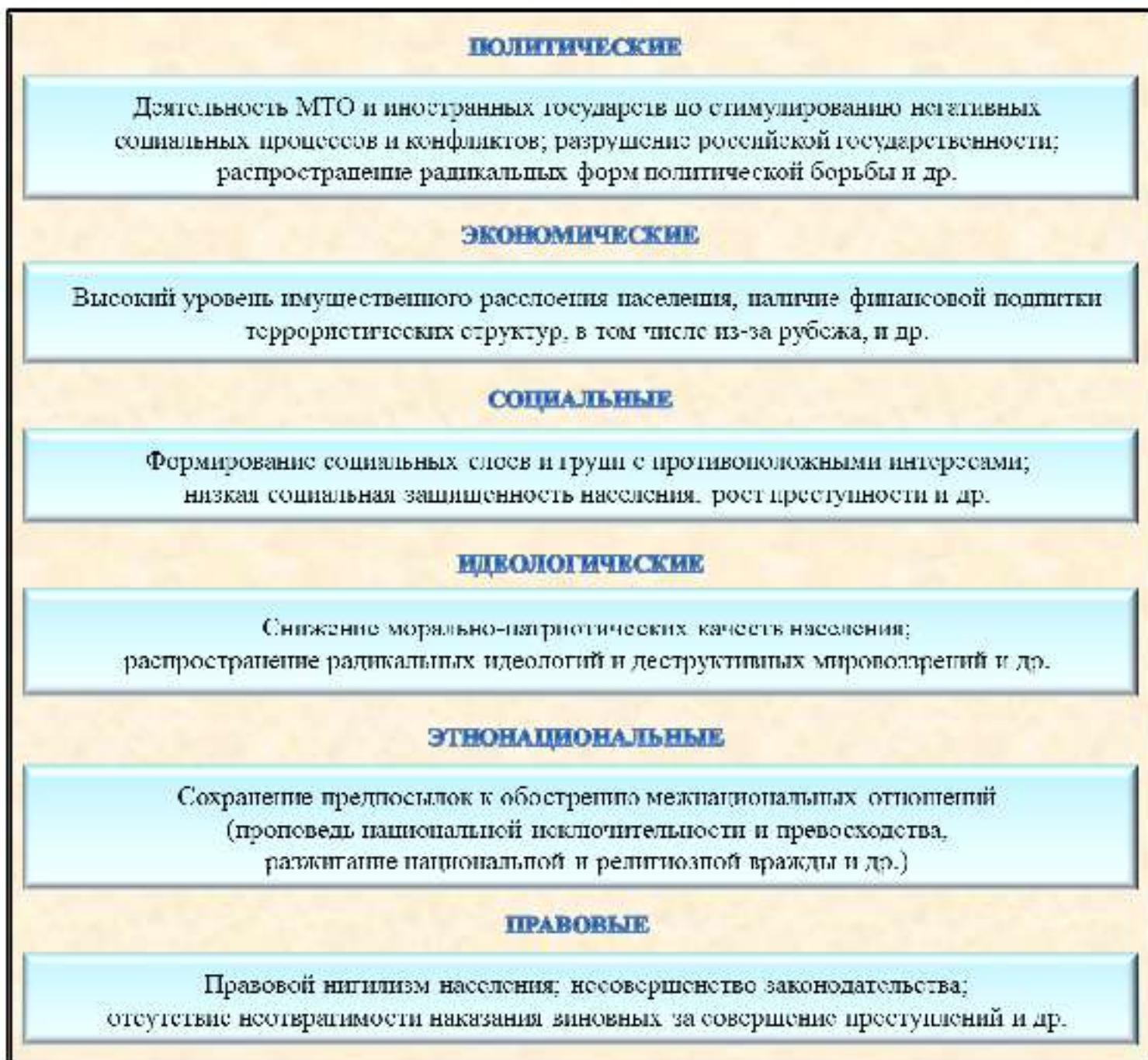
Рис 2. Факторы, способствующие сохранению террористических угроз в Российской Федерации

К правовым факторам относят низкую правовую грамотность населения, отдельных лидеров политических партий, организаций, движений, которая не позволяет адекватно оценить меру своей ответственности за совершаемые действия и их последствия; громоздкость процессуального законодательства; отсутствие эффекта своевременного и строгого наказания виновных за совершение преступных деяний и некоторые другие (рис. 2).