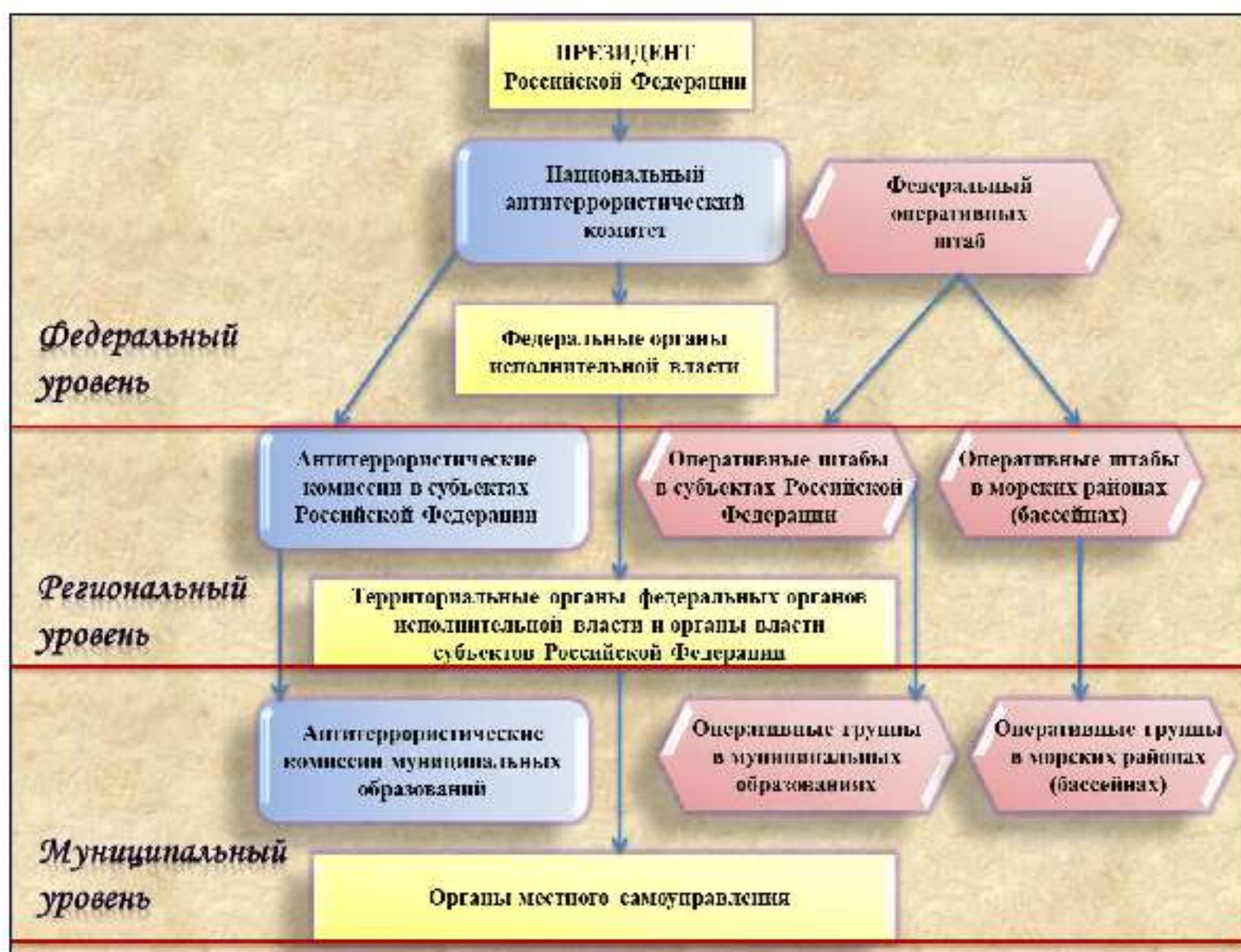
Рис. 6. Структура общегосударственной системы противодействия терроризму

осуществляют иные полномочия по решению вопросов местного значения по участию в профилактике терроризма, а также в минимизации и (или) ликвидации последствий его проявлений 1 (рис. 6).