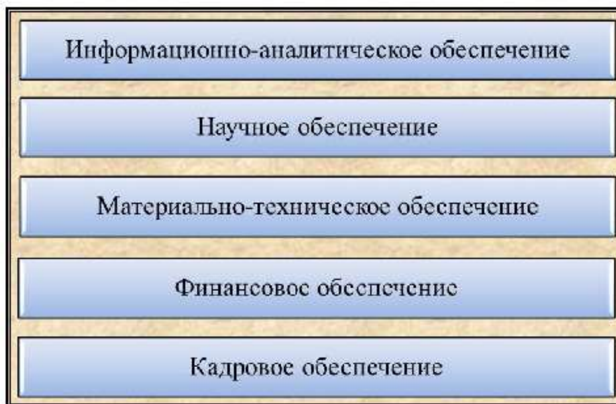
Рис. 7. Структура ресурсного обеспечения ОГСПТ

Эффективное решение задач по противодействию терроризму на общегосударственном уровне требует надлежащего ресурсного обеспечения деятельности ОГСПТ, в т. ч. информационно-аналитического, научного, материально-технического, финансового и кадрового (рис. 7).