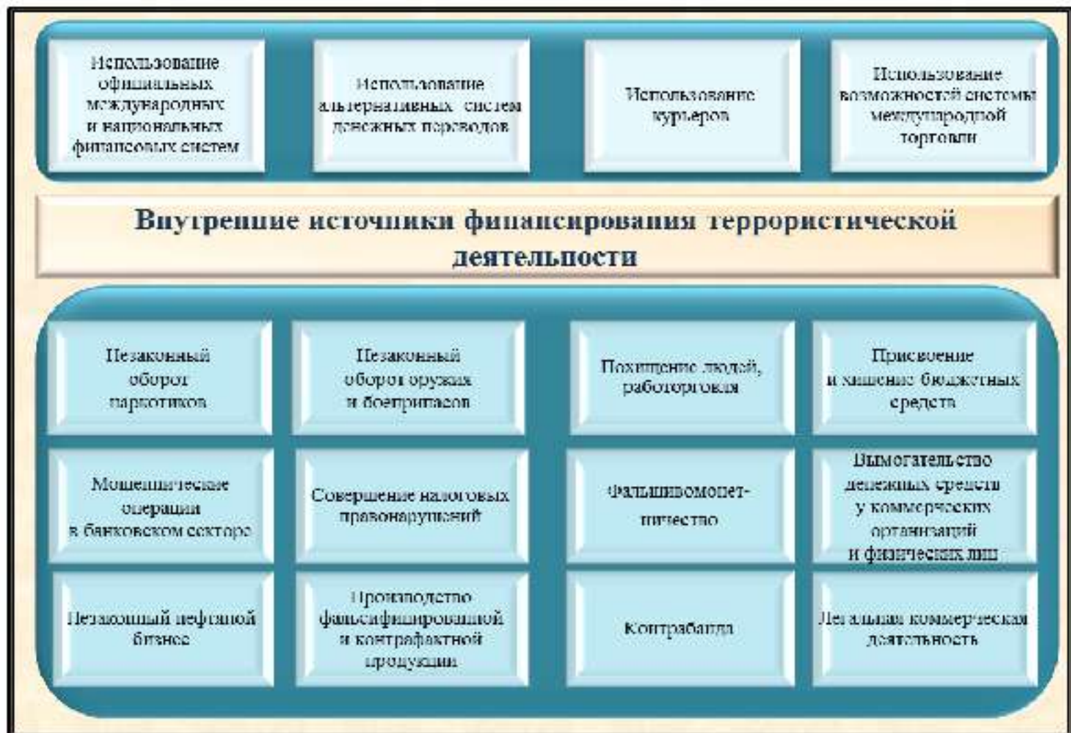
Рис.4. Основные методы и источники поступления финансовой помощи субъектам террористической деятельности на территории России

Кроме того, имеются примеры создания экстремистами и их пособниками легальных коммерческих структур, часть прибыли которых направляется на финансирование террористической деятельности.