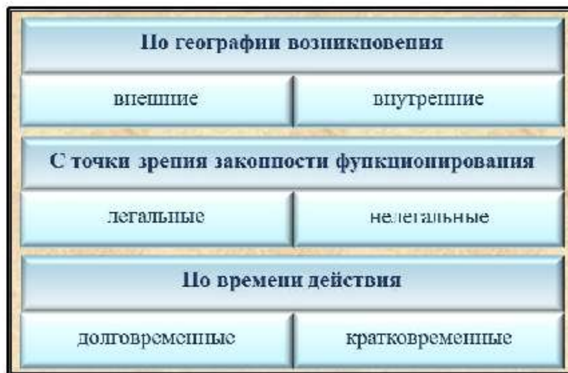
Рис.3. Классификация источников финансирования терроризма

Основными методами финансирования субъектов террористической деятельности на территории России являются: