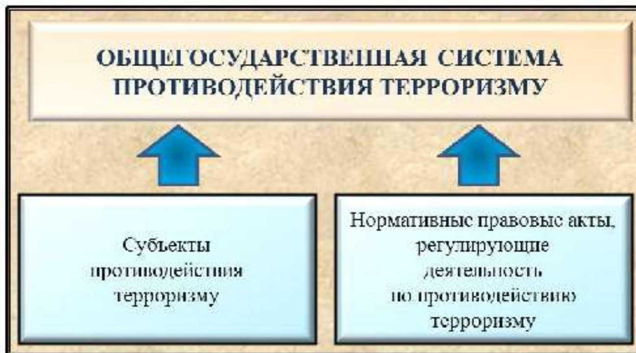
Рис. 5. Общегосударственная система противодействия терроризму

Согласно п. 5 Концепции противодействия терроризму в Российской Федерации (далее – Концепция) ОГСПТ представляет собой совокупность субъектов противодействия терроризму и нормативных правовых актов, регулирующих их деятельность по выявлению, предупреждению (профилактике), пресечению, раскрытию и расследованию террористической деятельности, минимизации и (или) ликвидации последствий проявлений терроризма (рис. 5).